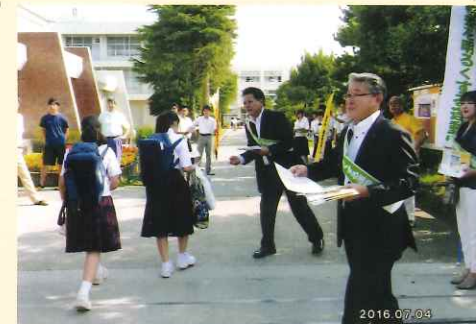
社明運動「リーフレット配布」