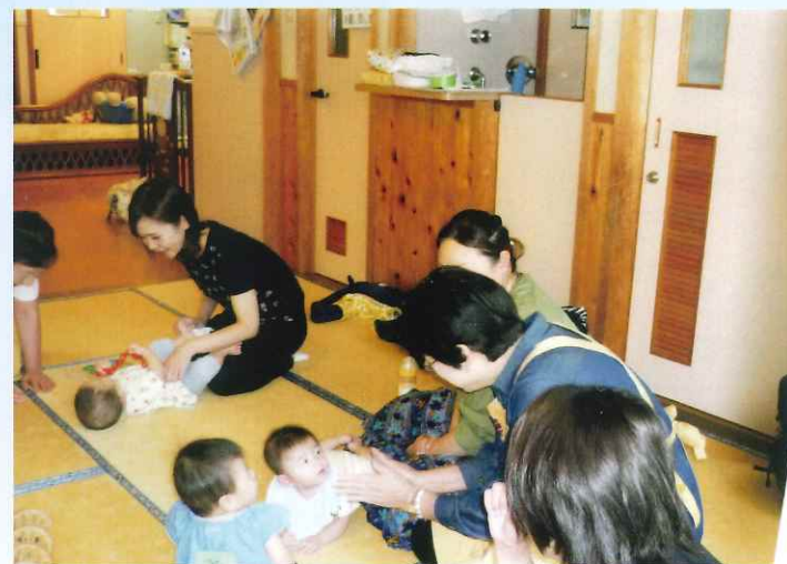
子育て支援センター「ゆりかもめ」にて