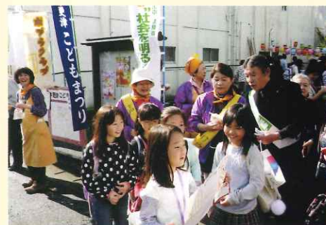
ティッシュの配布