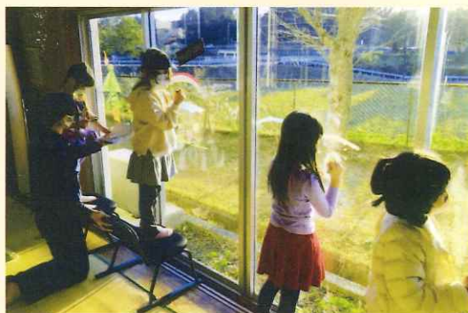
公民館の窓に絵を描こう