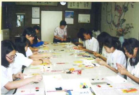
中学校でのしおり作り