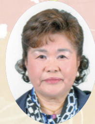
木更津市社会福祉協議会