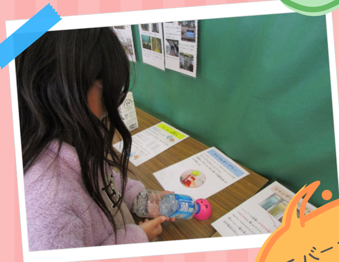
ユニバーサル デザイン体験