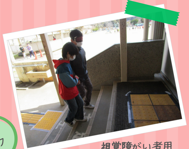
視覚障がい者用 用具体験