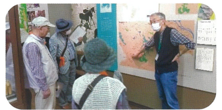
丁寧な説明に聞き入るみなさん