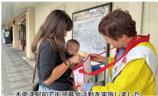
木更津駅前で行った街頭募金活動の実績です。