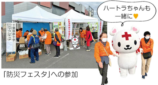
「防災フェスタ」への参加