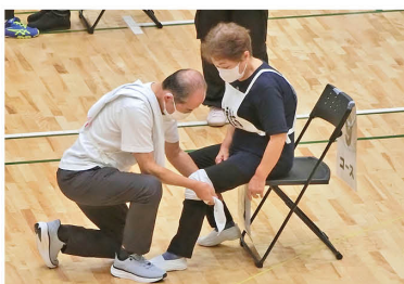
「赤十字救急法フェスタ2026」では傷病者に対して包帯法を実践!

現在、木更津市内には約150名の団員がおり、市内で行われる行事等で活動をしています。一緒に活動して頂ける仲間を随時募集しておりますので、ご協力いただける方は奉仕団事務局までご連絡ください。 ※活動される方は、年に1回ボランティア保険(年間290円)への加入をお願いしております。