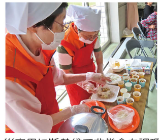
災害用に断熱袋で非常食を調理

【問合せ】 木更津市赤十字奉仕団事務局 ☎(22)6226 FAX(22)3550