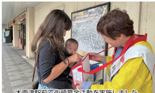
木更津駅前前で街頭募金活動を実施しました。