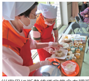
災害用に断熱袋で非常食を調理