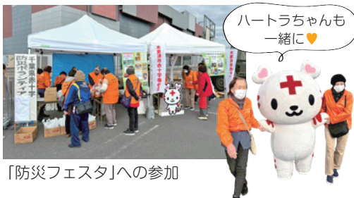
「防災フェスタ」への参加