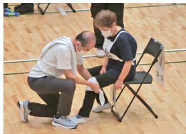
「赤十字救急法フェスタ2026」では傷病者に対して包帯法を実践!

※活動される方は、年に1回ボランティア保険(年間290円)への加入をお願いしております。